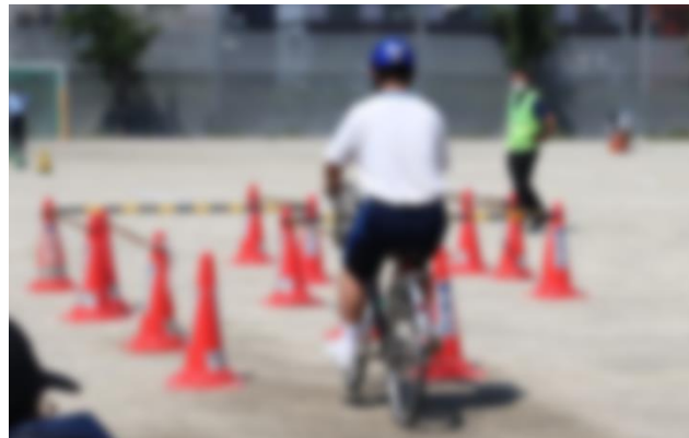
↑スマホを操作しながらの運転と、安全な自転車の走行を体験する3年 さん