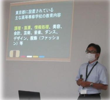
野田鎌田学園杉並高等専修学校 【情報高等科】【調理高等科】