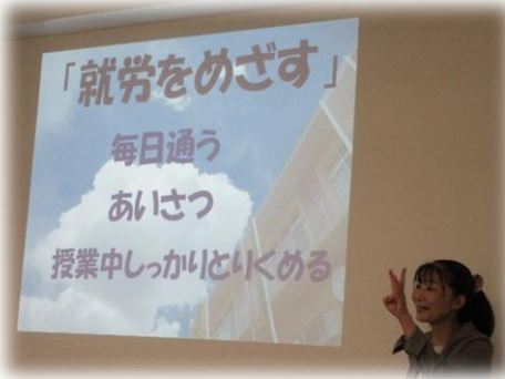
東京都立志村学園 【就業技術科】