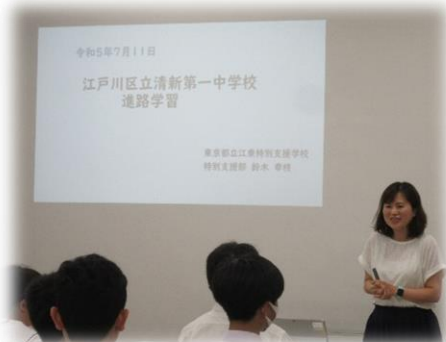
東京都立江東特別支援学校 【職能開発科】【普通科】

5月の進路説明会に続き、7月11日に「高校の先生の話聞く会」を行いました。F組卒業生にご縁のある学校の先生方をお招きしてお話を伺いました。3年生はこれまでに学校見学などにも行っていますが、行っていない学校のお話にも興味深く耳を傾けていました。1、2年生には難しい内容もあったと思いますが、これからじっくり考えていってほしいと思います。