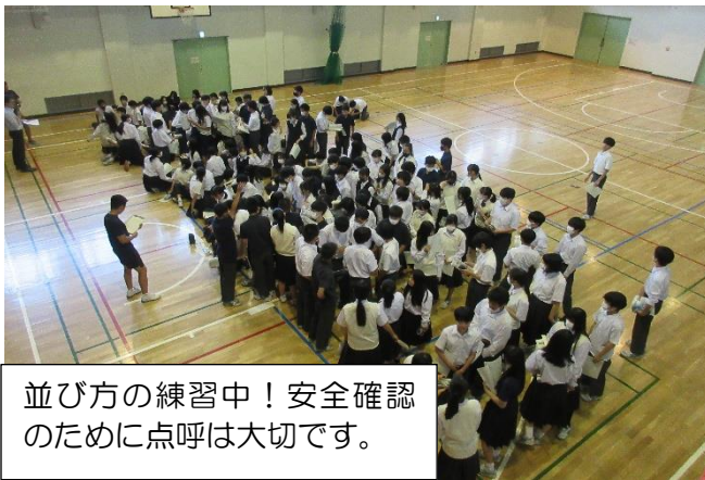
並び方の練習中！安全確認のために点呼は大切です。

ご家庭でも、林間学校のしおりをお子様と一緒にご一読いただき、内容やお子様の役割についてご確認ください。また、荷物の準備等もご協力お願いします。