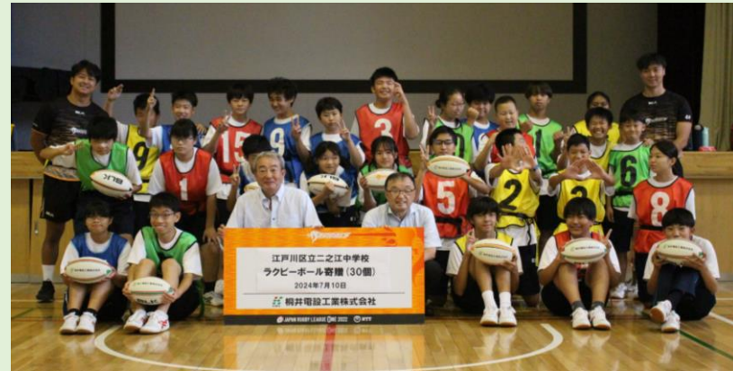
桐井電設工業株式会社様より ラグビーボール30個を寄贈して いただきました。

7月10日(水)、クボタスピアーズ船橋・東京ベイの方々がラグビーの指導に来てくださいました。2・3年生はルールやボールの扱い方も慣れてきて余裕をもって楽しむことができました。1年生は初めてのラグビーでしたが、目一杯体を動かし、いい汗を流しながら「もっとやりたかった!」と感想を言っていました。