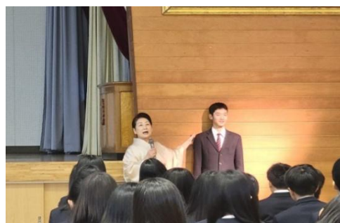
【マナー講座の様子】