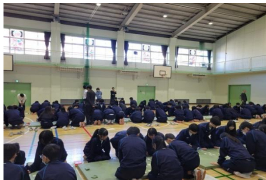
【百人一首大会の様子】