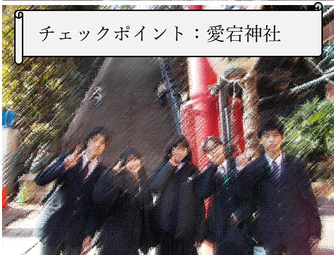
チェックポイント：愛宕神社