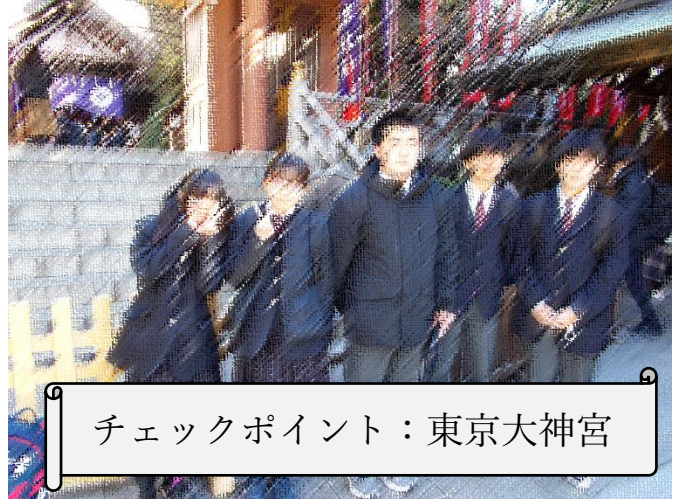
チェックポイント：東京大神宮