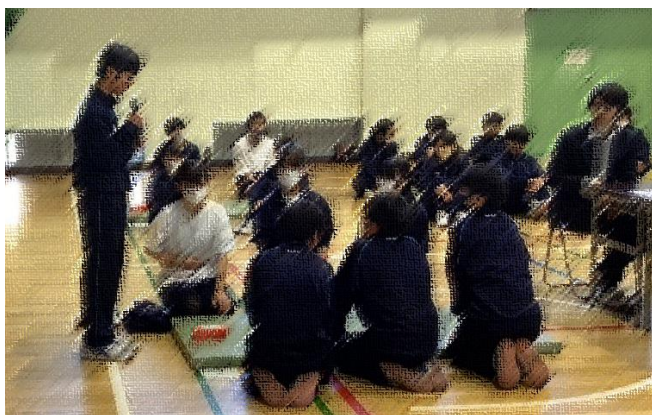
←開会宣言は3組〇〇〇〇さん

誰一人として諦めることなく百人一首に真剣に取り組んでいました。また来年やりましょう！