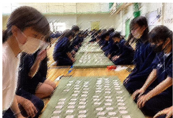
←「手は膝の上」がルールです！