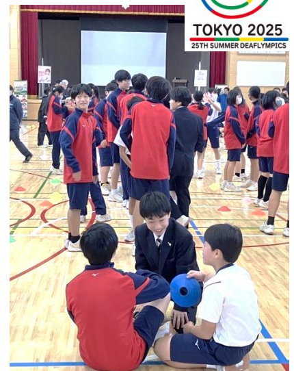
デフサッカー実演の様子