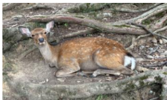
みんなで登った 奈良の階段→

奈良に到着後、カツカレーを食べ、東大寺の南大門で鹿と戯れました。生徒の中には、鹿に気に入られて友好の印に食べられている人も…?!その後、大きな大仏を見たり、法隆寺で社会の資料集に載っている五重の塔を見たりと、古都の知識を深めることができました。