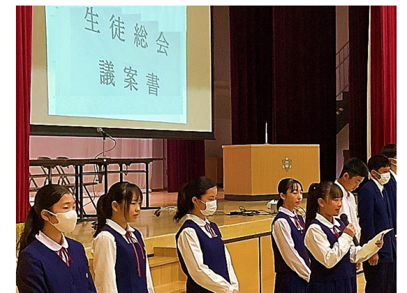
↑ 各クラスの学級紹介