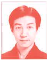
いちかわごまごろう 市川高麗蔵