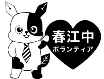
春江中学校キャラクター「はるん」