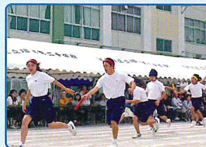
学級対抗リレー 3年