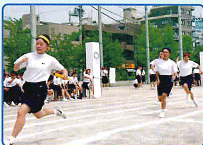
学級対抗リレー 2年