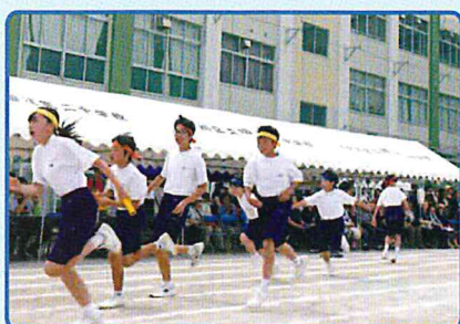
学級対抗リレー 1年