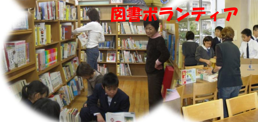
図書ボランティア