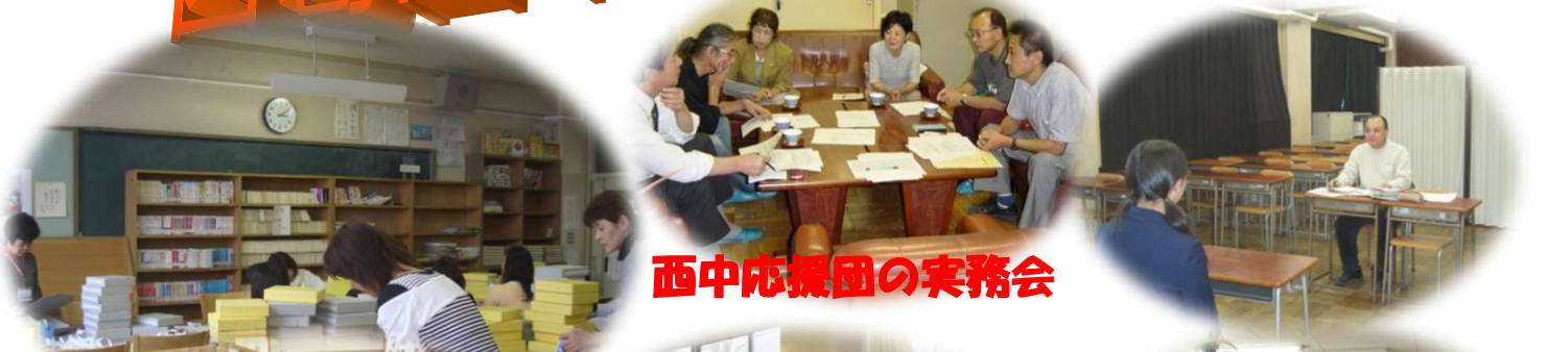
西中応援団の実務会