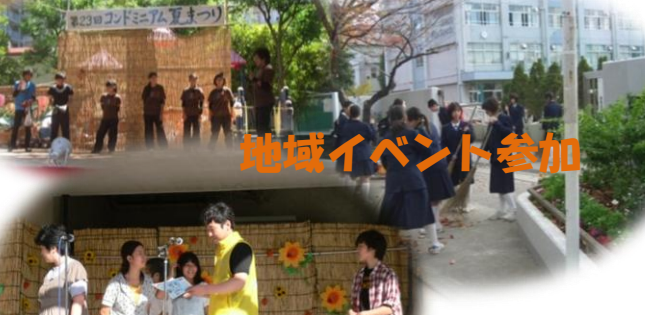
地域イベント参加