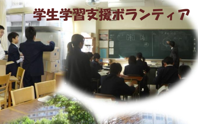
学生学習支援ボランティア