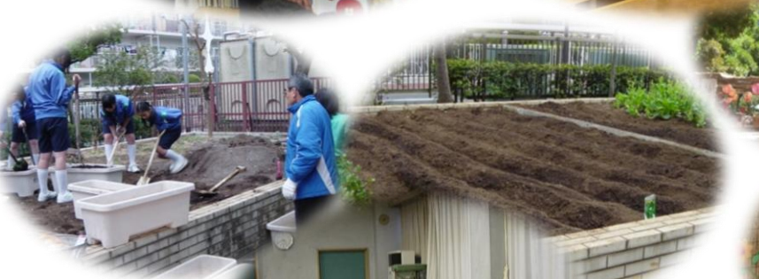
学校農園ボランティア