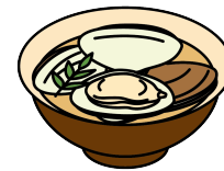
はまぐりのお吸い物

3月3日は「ひな祭り」。女の子の健やかな成長を願ってお祝いをする日本の伝統行事です。現在のように、ひな人形を飾ようになったのは江戸時代のことで、もとは人形を身代わりにして邪気をはらう「流しびな」が起源とされます。行事食として、ちらしずし、はまぐりのお吸い物、ひしもち、ひなあられなど、華やかな食べ物が並びます。