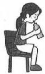
大量に汗をかいている場合は、塩分が入ったスポーツドリンクや経口補水液、食塩水がよいでしょう