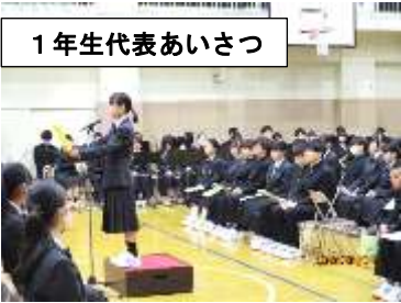
1年生代表あいさつ