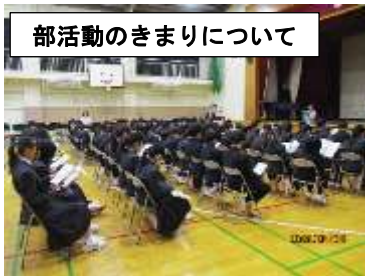
部活動のきまりについて