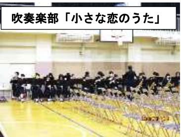
吹奏楽部「小さな恋のうた」