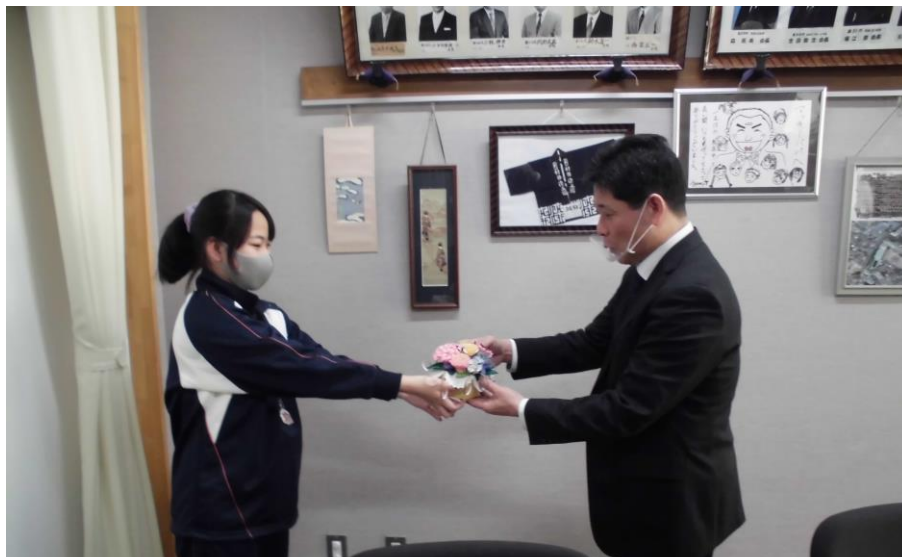
校長先生に依頼されたブーケをプレゼントする生徒