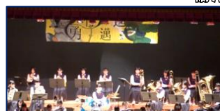
文化祭では一人一人が 輝ける