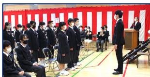
我がクラスは姿勢が自慢

世界でただ一つの学級ドキュメント映画は、学校行事や様々な行事で活用できたらすばらしいですね。