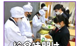
給食時間は みんなが協力