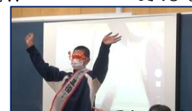
ユーモアいっぱい 学級委員