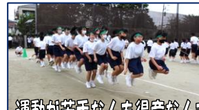
運動が苦手な人も得意な人も 協力し合えるクラス