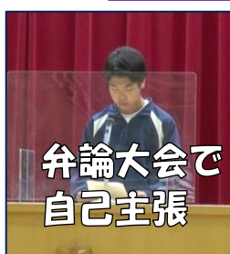
弁論大会で 自己主張