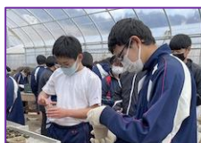
体験学習は 皆が積極的