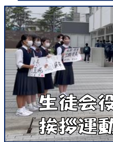
生徒会役員も率先して 挨拶運動します