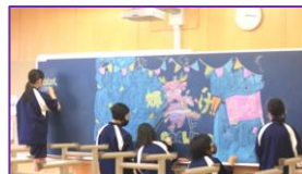
陰で動ける仲間がいっぱい