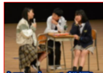
タワーホール船堀にて