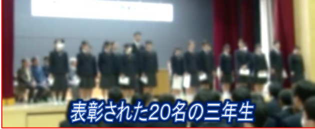
表彰された20名の三年生