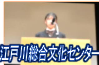
江戸川総合文化センターにて