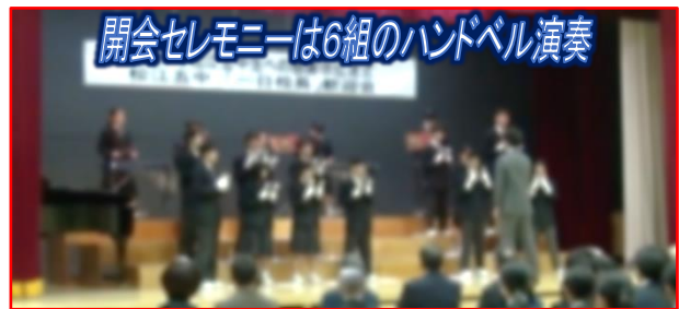
開会セレモニーは6組のハンドベル演奏

もうすぐ2025年、これからも引き続き、学校や地域社会の中で自分の得意な分野を生かし積極的に活躍する松江五中生が増えていくことを願っています。