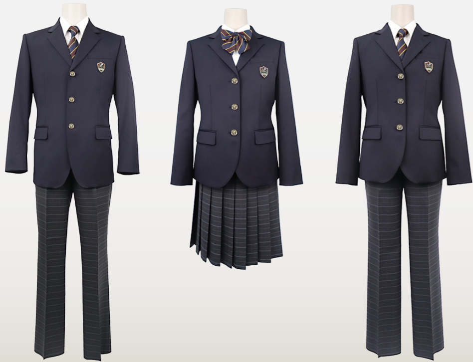
I 型スタイル ブレザー スラックス ネクタイ (従来の男子生徒型)

ブレザー (ウール40%・ポリエステル60%) スラックス (ウール30%・ポリエステル70%) スカート