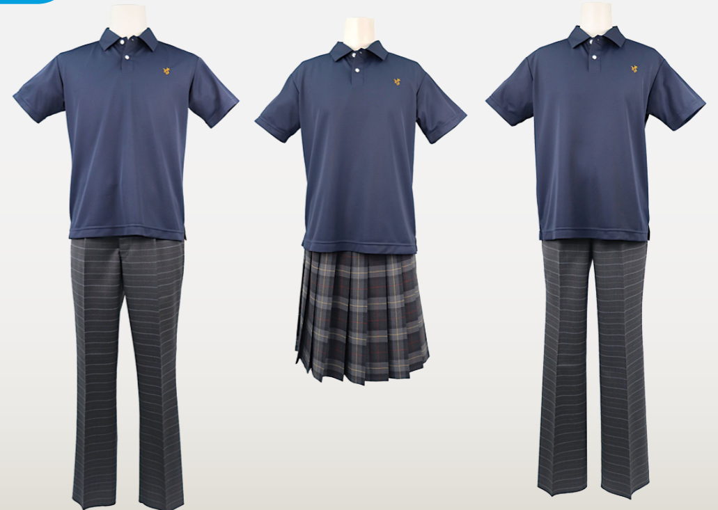
I 型スタイル スラックス (従来の男子生徒型)