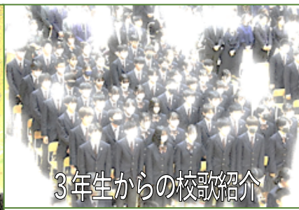
3年生からの校歌紹介