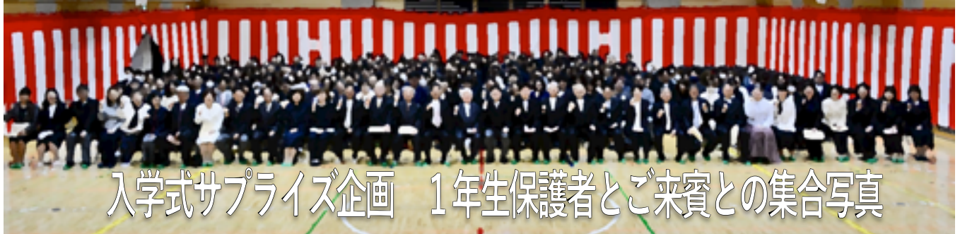
入学式サプライズ企画 1年生保護者とご来賓との集合写真