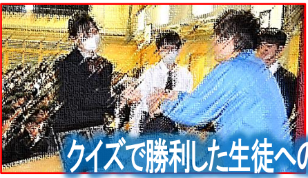
クイズで勝利した生徒へのサイン入り本のプレゼント