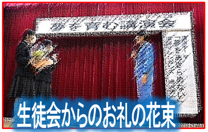
生徒会からのお礼の花束