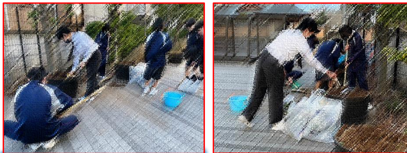
卒業式を前にウエルカムガーデンの手入れをする生徒会

寒い日の放課後、生徒会本部役員が正門から松五広場にかけて並ぶ花壇（ウエルカムガーデン）の手入れをしていました。卒業式に気持ちよく卒業をしてもらいたいという気持ちで取り組んでいたようです。心温まるこのような精神は松江五中の伝統であり、これまで引き継がれてきています。三年生が卒業した後もこういった松五精神を受け継いでいきましょう。