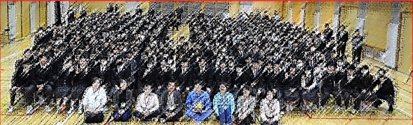
学校応援団たちばな(PTA)本部役員と講師、そして全校生徒での記念写真