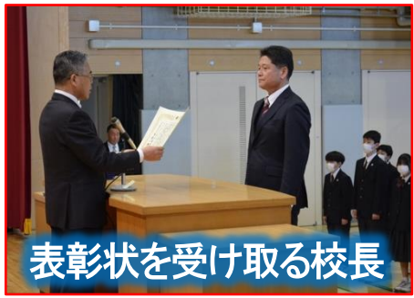
表彰状を受け取る校長

今年度、法務省と全国人権擁護委員連合会の主催する「全国中学生人権作文コンテスト」に学校として参加し、個人表彰と共に学校表彰をいただきました。3月10日(月)の朝礼では人権擁護委員の方々6名が来校され、直接表彰を受けました。このコンクールは、中学生が、日常の家庭生活や学校生活等の中で得た体験に基づく作文を書くことを通して、人権尊重の大切さや基本的人権についての理解を深め、豊かな人権感覚を身に付けてもらうことを目的としています。今回、本校としての作文コンクールへの取組は一年生を中心としたものでしたが、2年生、3年生を含めた応募校の中での「入賞」という結果はとても素晴らしいことだと思います。