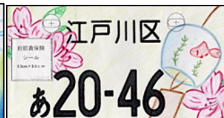
作品:ツツジと風鈴