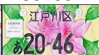
作品:ツツジとクスノキの