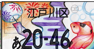
作品:I love 江戸川区!!