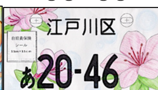
作品:ひらいたツツジ