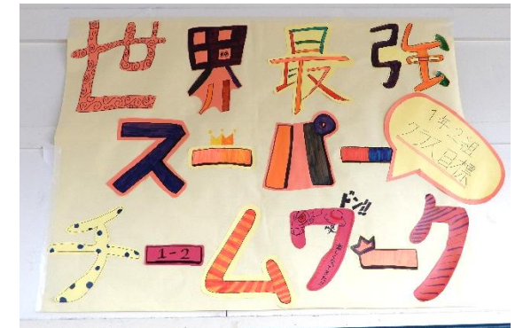
2組 世界最強 スーパーチームワーク