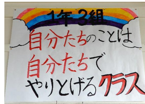
3組 自分たちのことは自分たちでやりとげるクラス