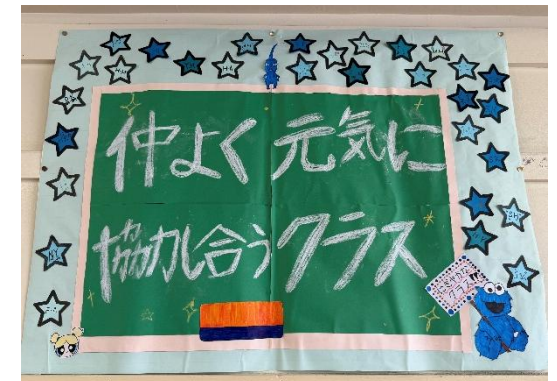
4組 仲良く元気に協力合うクラス