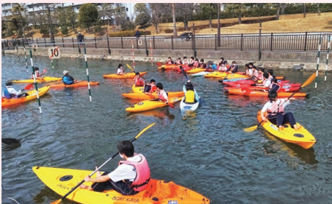
運河にてカヌースラローム体験

江戸川区オリンピック・スラローム会場に隣接している地域資源を生かして、新左近川親水公園運河にてカヌー体験教室を開催しました。また本区で取り組んでいる「中学生 自転車盗難無くし隊」に参加し、地域に進んで協力・貢献する態度を育みます。