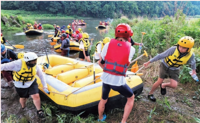
2年生林間学校 ラフティング 仲間との協力

2年生林間学校、3年生修学旅行の宿泊行事を充実させ、生徒が主体的に活動し、また寝食をともに過ごす中で仲間との絆を育みます。少子化の中だからこそ、他者と積極的にかかわる力を高めます。