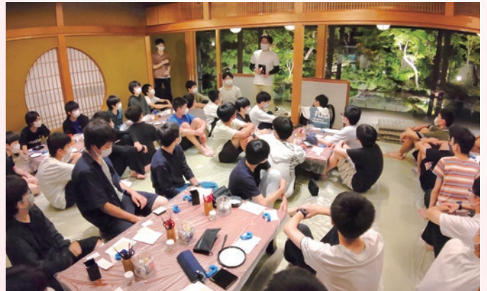
3年生修学旅行 京都 絵付け体験