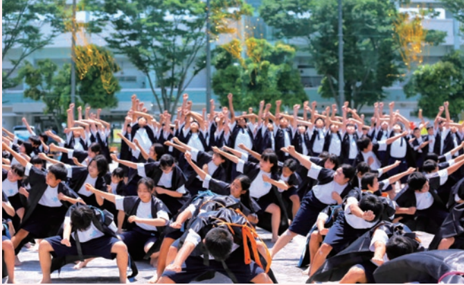
運動会 全校生徒によるソーラン節

本校では多様な学校行事をとおして、教員と生徒や生徒相互の信頼感を育み、主体的な体験を積み重ねる中で「知・徳・体」のバランスのとれた成長を促します。