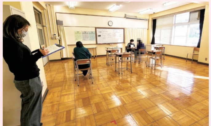
エンカレッジルーム 個別指導