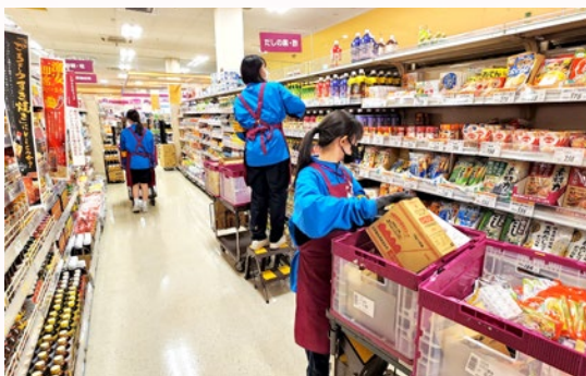
2年生職場体験 大型スーパー品揃え

卒業後の進路を視野に入れ、きめ細やかな進路指導を行っています。2年生においては40か所以上の地元事業所・企業のお力添えをいただいて5日間の職場体験「チャレンジ・ザ・ドリーム」を実施しています。働くことの喜びや苦勞を体験し、進路を選択していく上での基盤を培います。