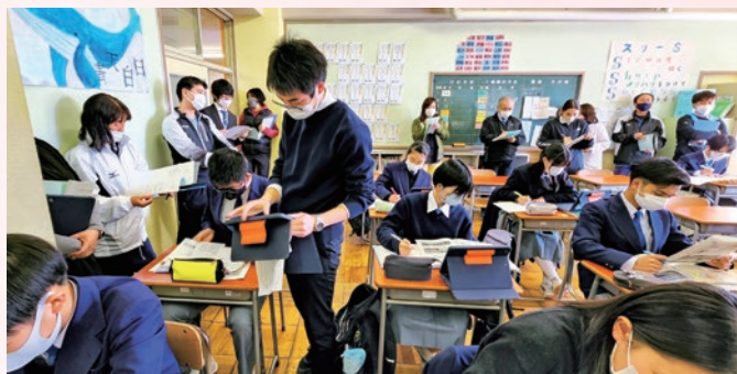
iPadを活用した「社会」研究授業