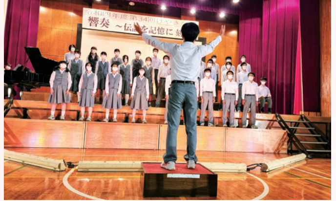
けやき祭 合唱コンクール