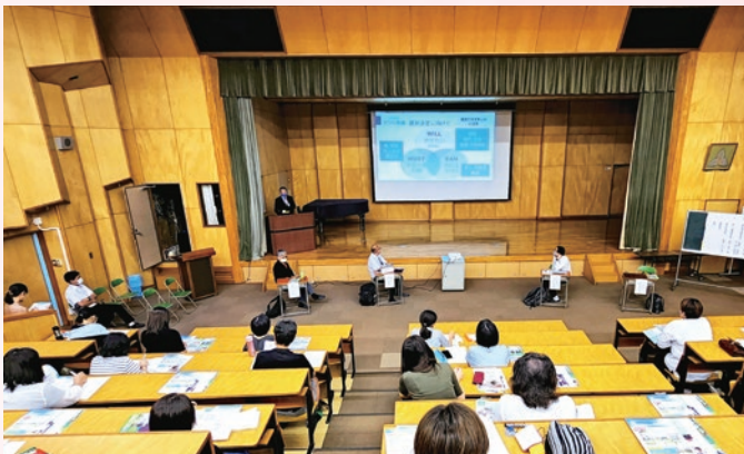
特別支援教室 保護者対象「進路考える会」