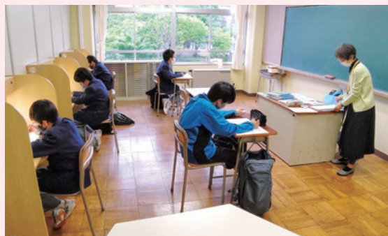
放課後補習教室の様子

令和4年度から江戸川区教育委員会が開始した「江戸川区放課後補習教室」に、 令和5年度は新規に「英語」の補習も加え 、一層その取り組みの充実を図ります。学習塾Z会グループ「株式会社エデュケーションネットワーク」からの講師の先生の派遣を受け、生徒は週に一回都合のよい曜日を選んで、午後4時から6時までの2時間、「 数学 」「 英語 」の補習に取り組みます。本校独自に 一回の講座の受講生を3名に絞り込み 、年間150回の講師派遣を有効に活用します。