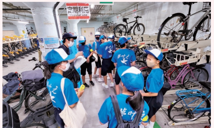
「西葛西駅」駐輪場にて施錠状況の調査