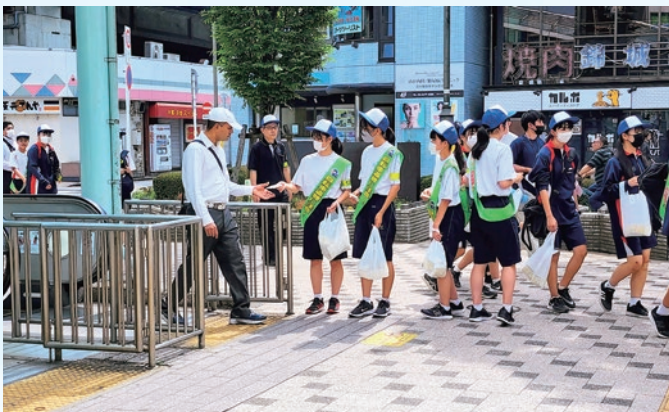
「西葛西駅」での啓発用ティッシュの配布

江戸川区で取り組んでいる「中学生 自転車盗難無くし隊」に参加し、地域に進んで協力・貢献する態度を育みます。また江戸川区全体で取り組んでいる歯の健康促進事業を真摯に受け止め、学校全体で給食後の歯ブラシに取り組みます。限られた水道設備に考慮し、取り組む学年・学級や実施時期を区分するなど工夫して、学校全体で推進します。