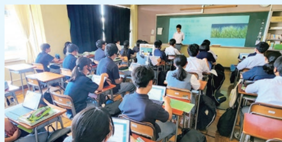
自分の手法で調べ、仲間に教える授業

文部科学省が唱える「GIGAスクール構想」に基づき、江戸川区より貸与されたiPadタブレットを活用し、 情報収集力・情報選択力 を高めながら、調べ学習や課題解決学習を推進し、生徒の 思考力・創造力 を育みます。生徒自らが学び (個別最適な学び)、仲間と協議し (協働的な学び)、生徒自らが情報発信する授業を推進します。