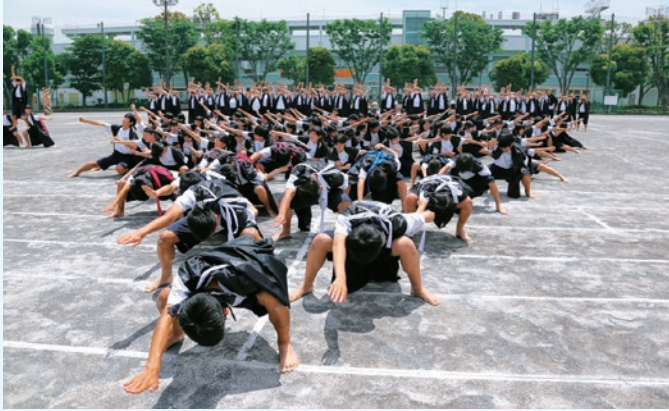
運動会 全校生徒によるソーラン節

本校では多様な学校行事をとおして、教員と生徒や生徒相互の信頼感を育み、主体的な体験を積み重ねる中で「知・徳・体」のバランスのとれた成長を促します。