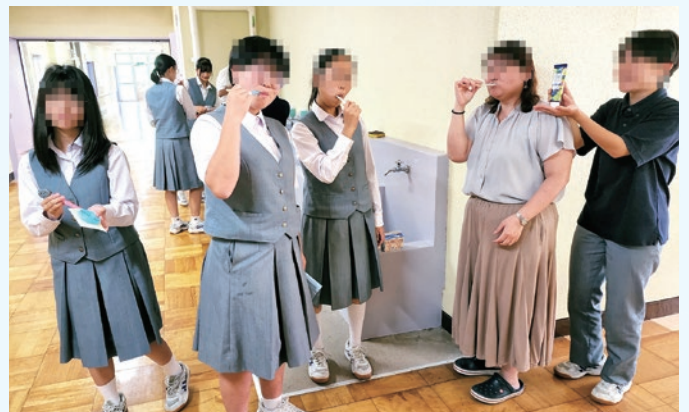
給食後の歯ブラシの習慣化 先生と一緒に歯ブラシ