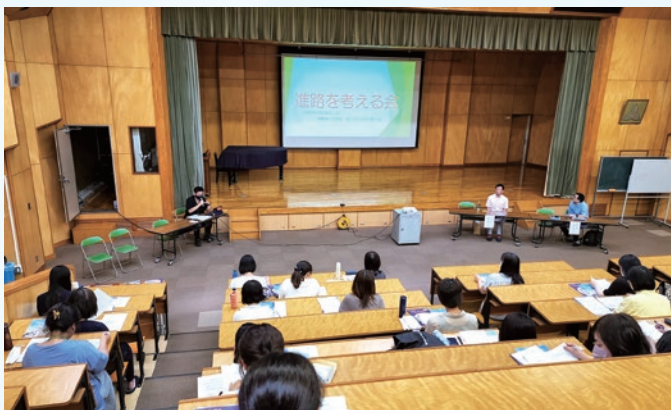
特別支援教室 清二グループ保護者対象「進路を考える会」