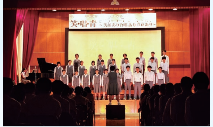
けやき際 合唱コンクール