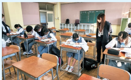
放課後補習教室の様子

令和4年度から江戸川区教育委員会が開始した「江戸川区放課後補習教室」の主旨を十分に理解し、一層その取組の充実を図ります。学習塾 Z会グループ「株式会社エデュケーションネットワーク」からの講師の先生の派遣を受け、生徒は週に一回都合のよい曜日を選んで、午後4時から6時までの2時間、「 数学 」「 英語 」の補習に取り組みます。本校独自に 一回の受講生を3名に絞り込み 、4期に分けて生徒を募集して、年間150回の講師派遣を有効に活用します。