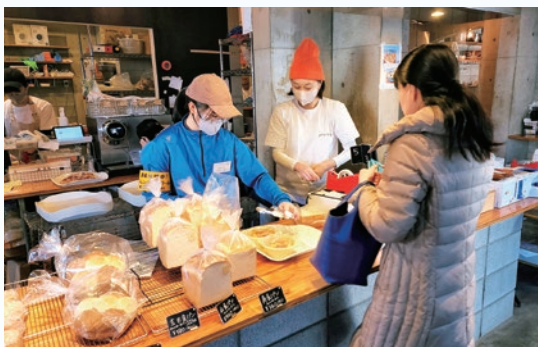
2年生職場体験 地元パン製造販売店

卒業後の進路を視野に入れ、きめ細やかな進路指導を行っています。2年生においては40か所以上の地元事業所・企業のお力添えをいただいて5日間の職場体験「チャレンジ・ザ・ドリーム」を実施しました。働くことの喜びや苦勞を体験し、進路を選択していく上での基盤を培います。