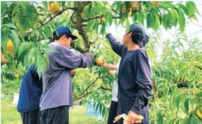
2年生林間学校 農家民泊 果樹園での収穫作業

2年生林間学校、3年生修学旅行等の宿泊を伴う行事を充実させ、仲間と積極的にかかわる力を高めます。少子化の中だからこそ、他者と協力する経験・体験を重ねます。