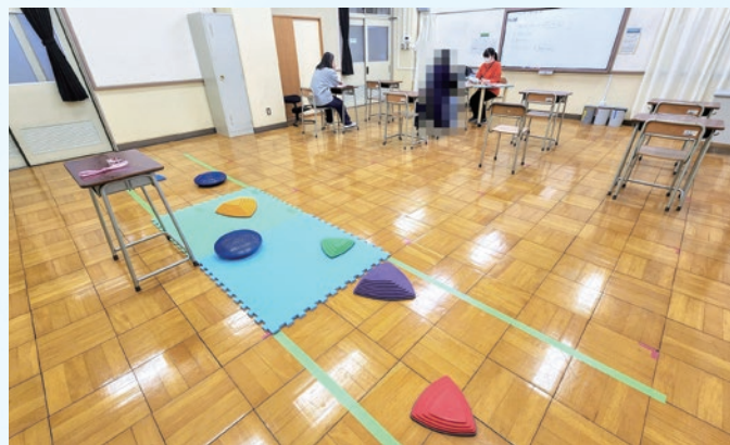
エンカレッジルーム 個別指導