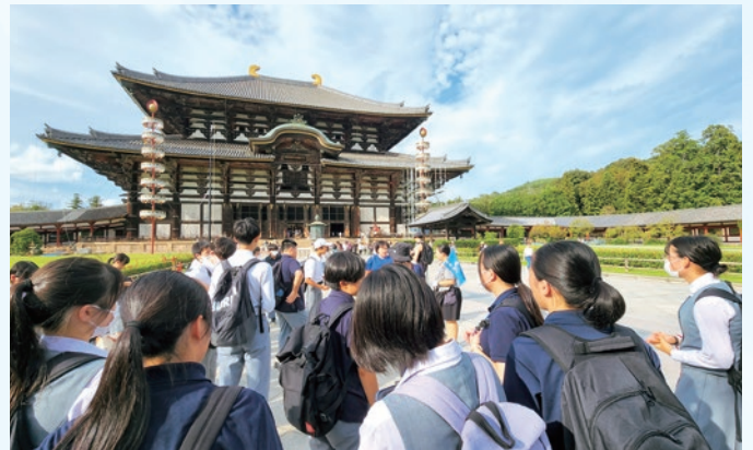
3年生修学旅行 奈良 東大寺大仏殿