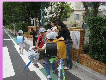
アルミ・スチール缶回収