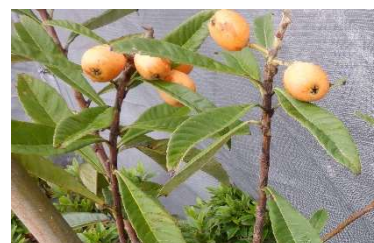
校庭のザクロとビワ