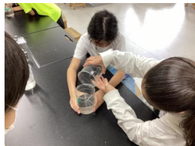
下水道キャラバンでの実験