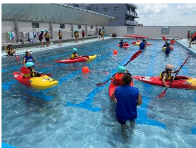
カヌー教室の様子

今年度は、7月22日（月）～8月1日（木）が夏季水泳期間です。各学年の割り当て日は後日配布します。水泳がある日は、水泳カード、水着、水泳帽、タオルを忘れずに持たせるようお願いいたします。