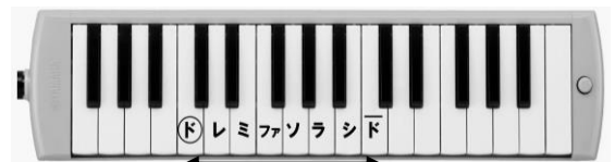
ここからここまででいいです。

鍵盤ハーモニカについては、写真のように鍵盤にドレミを書いてください。ご家庭で準備されている方も、同様をお願いいたします。