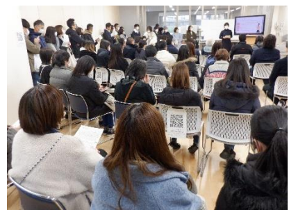
1月20日セーフティ教室