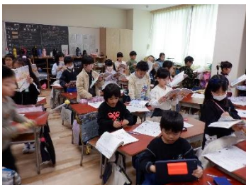
毎週水曜日の朝学習

「1月行く、2月逃げる、3月去る」と言われるように、この三学期は、あっという間に過ぎていくのを毎年感じています。1月の初めに教職員には、だからこそ、一日一日、一時間一時間の授業や活動を大切にしていこうと、そして、今の学年の学びを確実に身につけさせて次の学年に送ることが求められているということを話して確認しました。今年度、力を入れていく柱の一つは学力向上です。基礎的な力をつけるために毎週水曜日の「朝学習」では学習タブレットでドリルパークの算数と国語に取り組みました。家庭学習で全学年一斉に取り組む「スタディウイーク」も行いました。4月に行った一人一人の CDT テストの結果や一学期と二学期に行った東京都ベーシックドリル診断テストの結果から、一人一人の苦手とするところを担当が児童の段階に応じて助言して取り組みせ、その進捗状況を確認していきます。また、毎日の授業や活動では、みんながわかる授業にするための授業のユニバーサルデザイン化を行ってきました。めあてを分かりやすくする、課題を把握できるためや行動を分かりやすくするための視覚的な提示、明確な言葉の指示、そして個別の支援のタイミングと内容です。それらによって、全ての児童が自分で課題解決に向かうことができたと喜びを感じる授業です。たとえば、二年生で8の段のかけ算を自分で作る際に、たし算を使って作っていくことの少しの助言から、自分でどんどん考えてノートいっぱい考え方を書いている姿を見ました。子供が自分で考えていく方向がわかった瞬間から目が変わっていました。そのような瞬間を作っていくことが私達の使命だと考えています。また、今年度は140周年を捉えて地域を知る学習を各学年で行い、調べたことを各学年に応じて表し、多くの方に見ていただきました。また、これからの篠崎をよりよくするためのSDGsの行動を示して実践しているところです。子供たちが地域を愛することが深まり自分も周りの人のことを考えて動くことができる児童に近づいてきていると、おのずと挨拶もできる児童になります。学校では、この時期はどこまでできたかを振り返っている時期でもあります。保護者や地域の皆様からのアンケートのご意見を参考に来年度に向けてさらに改善していくことを計画しております。