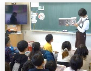
読み聞かせ、みんな真剣。