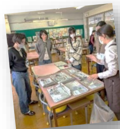
司書さんとボランティアさん。相談をしています。