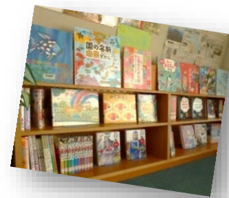
新しい本がいっぱい!

今学期も司書さんと図書ボランティアさんが協力して活動してくださいました。江戸小の図書館がますます明るく、楽しい場所になっています。また、11月には新しい本もたくさん入りました。物語の本はもちろん、図鑑や伝記など知識の本もありますよ。