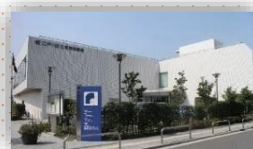
江戸川区立東部図書館