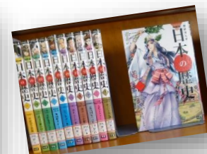
new 日本の歴史/学研まんが