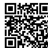
連絡メール2 保護者ログイン

* 保護者サイト https://renraku.education.ne.jp/parent/