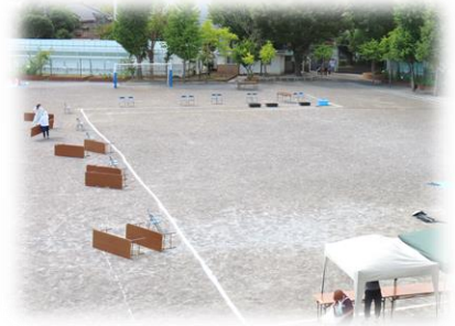
(上)PTA の方々による準備 (左)本校の金管バンドの演奏