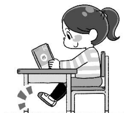
足が床につかない