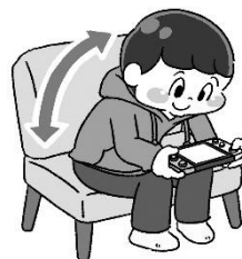
背中が曲がっている