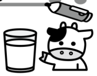
夏…乳脂肪分が少ないさっぱりとした味

牛乳は生きている牛から生産されるので、牛の品種や育て方、えさの違いなどによって風味が変わります。また、牛は暑さに弱く、夏は食欲が落ちて水分を多くとるため、乳脂肪分が少ないさっぱりとした味の牛乳になり、秋から春先にかけては、乳脂肪分が多い濃厚な味の牛乳になります。寒くなると、給食では牛乳の残りが多くなりがちですが、冬ならではの牛乳のおいしさを、ぜひ確かめてみてください。