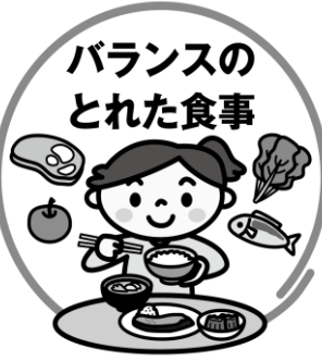
バランスのとれた食事