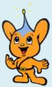
ピーポくん 警視庁 シンボルマスコット

特殊詐欺で逮捕された少年3名に対し、インタビュー形式で聞き取りをしたものです。各警察署少年係へ連絡の上、利用できます。