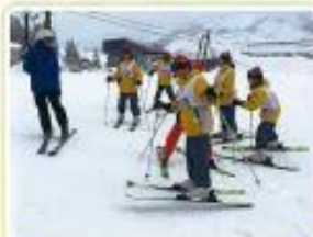
ウイントースクール