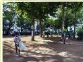
クリーン作戦（地域清掃）