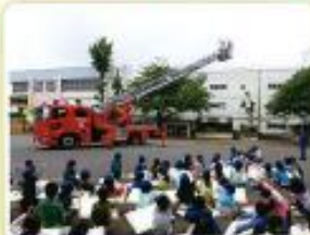
はたらく隊防のひまわり