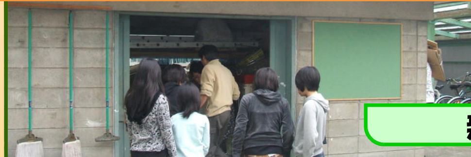
新聞1部運動・紙のリサイクル

ペットボトルのキャップ家から持ってきています。 江小P連さんとの協力です。 玄関の回収容器に自分で入れます。