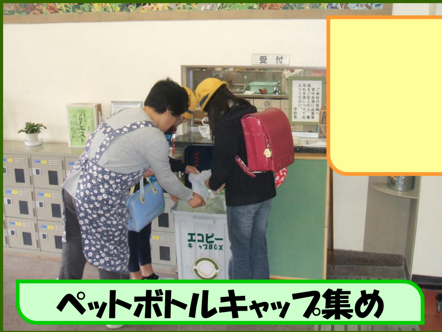
ペットボトルキャップ集め

ペットボトルのキャップ家から持ってきています。 江小P連さんとの協力です。 玄関の回収容器に自分で入れます。