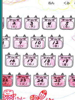
2がつ きゅうしょくカード

毎月1回、「パクパク給食」 があります。低学年は 「きゅうしょくカード」 を使って、 全部食べられた日には赤 色をぬります。