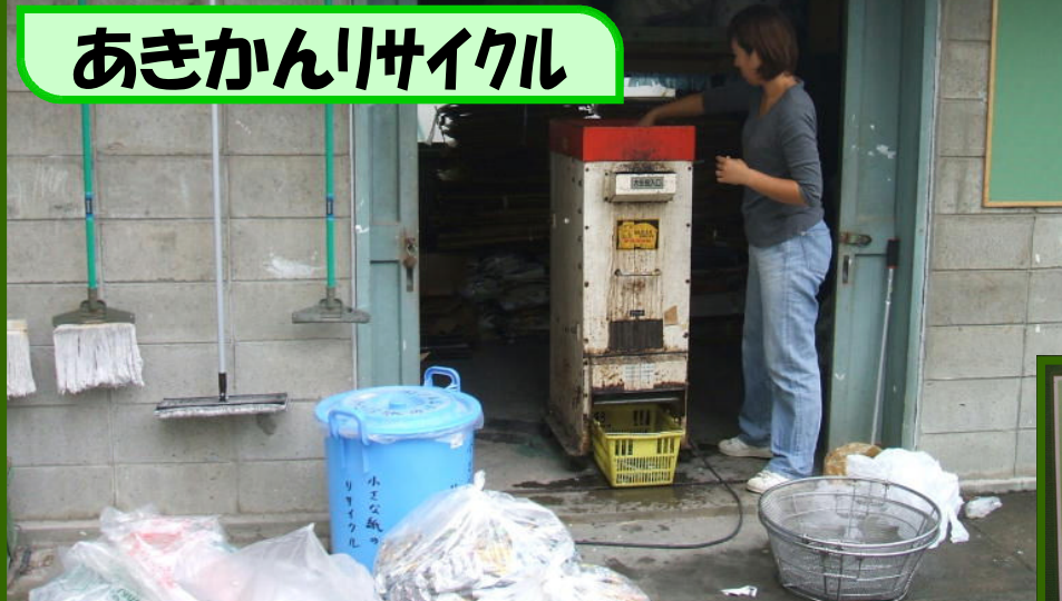
あきかんリサイクル

本校PTAさんの廃品回収です。 毎週のアルミ缶回収とアルミ缶溜りです。 また、年に4回廃品回収を実施します。 新聞・雑誌・段ボール・アルミ缶です。