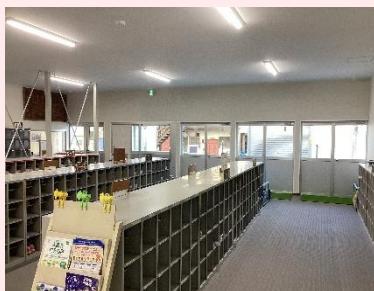
上:おはよう玄関 (1階玄関ホール)

さて、愛称名を見ると、「中小岩Ⅱ」や「思い出校舎」、「おはよう玄関」、「月の階段」など、中小岩小学校で学ぶ子どもたちの思いやイメージがにじみ出ています。この愛称名は、学校からの案内や対外的な通知など、正式名称と同様に使用していきます。また、今後校内の各施設に名称板を設置したり、ホームページでも掲載したりするなど、愛称名が浸透するよう進めてまいります。