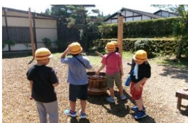
日光江戸村から(7/23撮影)