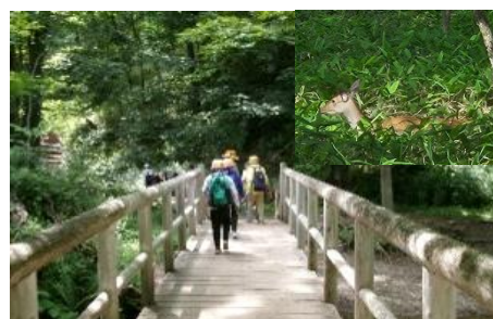
戦場ヶ原ハイキング(7/22撮影)

日光連合宿泊行事の様子を、ホームページ内の みどり学級のサイト で、ご覧いただけます。