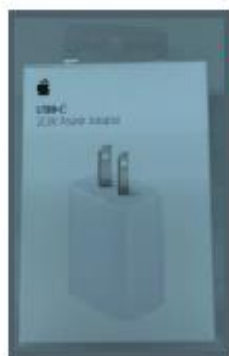
貸与アダプタ USB-C 20W Power Adapter

※タブレットの適切な使い方をすること！2月下旬ごろ、6年生はタブレットと充電器を江戸川区に返却します。大切に使いましょう。故障・紛失等で充電アダプター・ケーブルの買い替えをしている方は、最初に貸し出した物と同じ物（apple 社純正品の物）を返却してください。