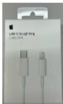
貸与ケーブル USB-C to Lightning Cable(1m)