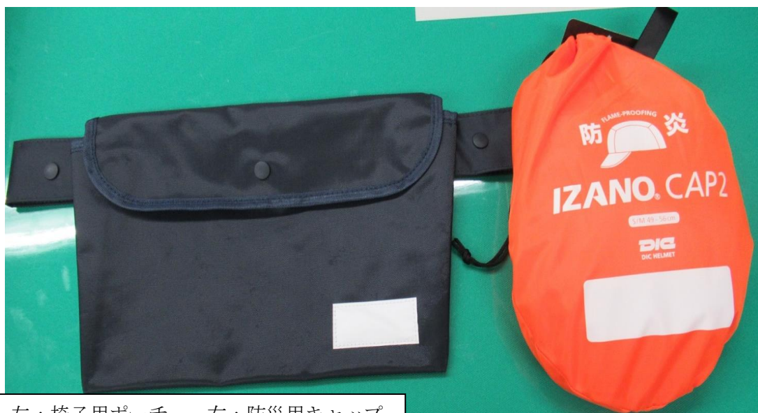
左：椅子用ポーチ 右：防災用キャップ

※上記の学用品の購入は、次年度の予算成立を前提にしております。なお、次年度予算は、3月に第1回区議会定例会の決議を経て決定する予定です。