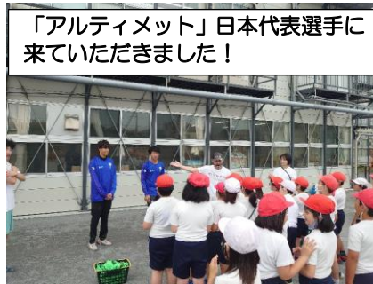
「アルティメット」日本代表選手に来ていただきました！