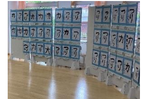
はじめての毛筆(書写)