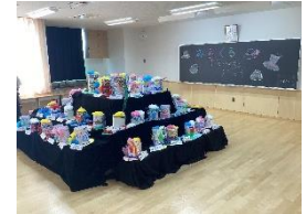
みらくるドリームハット(図工)