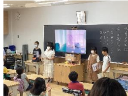
昔の道具調べ(総合・社会)