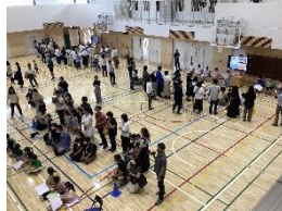
だいすき こいわしょうがっこう(生活科)