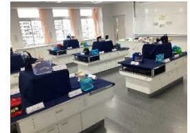
アップサイクルトートバッグ(家庭科)