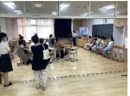
Our Universal Design Plan～私たちの考える共生社会～(総合)