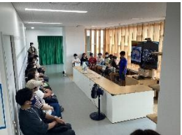
My人権宣言～今、自分が大切にしたいこと～(総合・道徳)