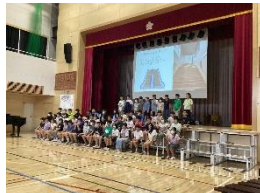
将来の自分たちへ～これまでとこれから～(総合・音楽)