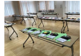
マイマスコット(家庭科)