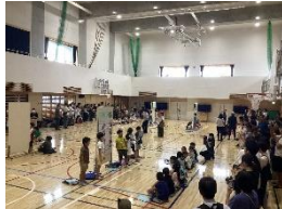
小岩小ではたらく人々(生活科)