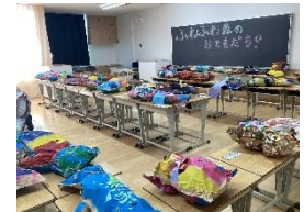
ふわふわ森のおともだち(図工)