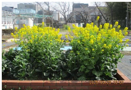
3月下旬、裏庭の菜の花が満開です。青空の下菜の花の香りが一面に広がっていました。

新1年生35名が入学し、令和7年度がスタートしました。皆さんが元気に楽しく学校生活を送ることができますように心と体の健康に向けて、保健室からもサポートしていきます。また、4月は、定期健康診断が始まります。ほけんだよりやお知らせ等でその都度お伝えしていきますので、御家庭の御理解と御協力をよろしくお願いします。