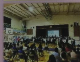
学習発表会における「SDGs学習の発表」