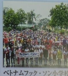
ベトナムフック・ソン小学校 との交流