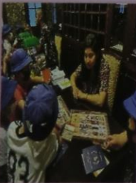
外国の文化を学ぶ 国際理解学習