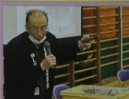
地域に学ぶ ふるさと学習