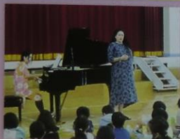
文化芸術出前授業