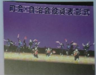
引き継ぐ伝統「御神楽」