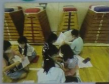
マスター学習 (漢字・九九・ハロー)