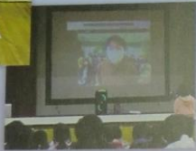
オンライン 交流授業