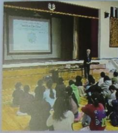
道徳授業地区公開講座