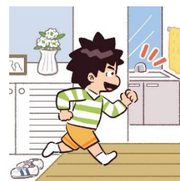
外出から帰った後