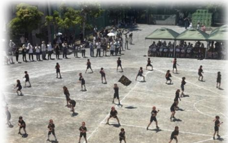
3年 和ロック～祝いの舞～

5月30日(土)の開校55周年記念運動会では、たくさんの声援をありがとうございました。職員室から、それぞれの学年の練習過程を見ていたので、当日の子供たちの頑張る姿には胸を打つものがありました。特に最高学年の6年生の組体操は全員で揃えるところもあれば、