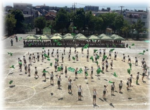
6年 「百花繚乱!～花咲け東っ子～」

令和10年度の新校開校に向けて、いよいよ改築工事が始まります。特別教室の改修工事が夏休みを目途に行われます。子供たちの利用頻度の低い教室は7月から順次工事を始めます。工事に伴い、7月よりプール横の東門が利用できなくなります。朝の登校時には、正門からの登校となります。また、学童・すくすくについても使用教室が変更されます。詳しくはすくすくスクールスタッフよりお知らせします。ご不便をおかけしますが、ご理解ご協力をお願いいたします。