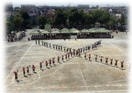
1年「Go Go 1年生 Go Go ダンサーズ」

個々の得意なことを生かした部分もあり見応え抜群でした。今後も日光移動教室や学習発表会に向けて、一人一人が悔いをのこすことなく行事に取り組んで欲しいと思います。運動会後にお寄せいただいた感想は、来年度の参考にさせていただきます。ありがとうございました。